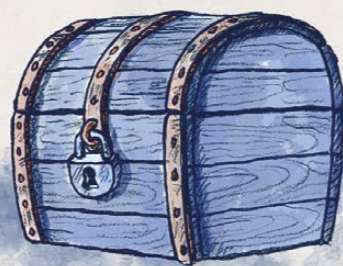
Un cofre enigmàtic