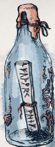
Un poderós encanteri

Aquesta audioguia és una proposta de Lambú Comunicació per a l'Ajuntament d'Arenys de Mar. Guió i locució: Marta Catalan • Música i edició: Albert Nardi • radiocontes.cat • Il·lustracions i grafisme: TxeniGil.com