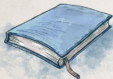
Una misteriosa llibreta